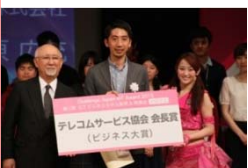
テレコムサービス協会会長賞 (ドレミングアジア)

自分の主張を的確に表現すること。インカムをつけ舞台を自由に動き、自分のプレゼンにあったスタイル&パフォーマンスを期待しています。