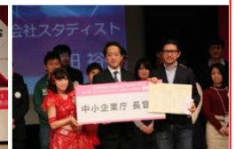
中小企業長官賞 (スタディスト)