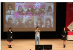
女性起業家大賞 (うまぶぶ)