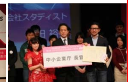
テレコムサービス協会会長賞 (ドレミングアジア)