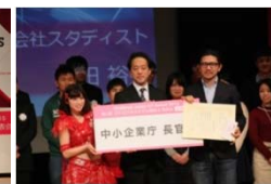
中小企業長官賞 (スタディスト)