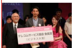
テレコムサービス協会会長賞 (ドレミングアジア)

自分の主張を的確に表現すること。インカムをつけ舞台を自由に動き、自分のプレゼンにあったスタイル&パフォーマンスを期待しています。