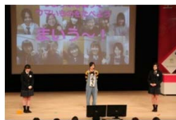
女性起業家大賞 (うまぶぶ)