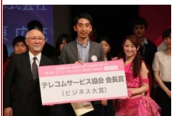
テレコムサービス協会支部会長賞 (ドレミングアジア)

自分の主張を的確に表現すること。インカムをつけ舞台を自由に動き、自分のプレゼンにあったスタイル&パフォーマンスを期待しています。