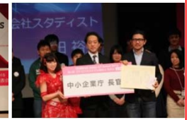
中小企業長官賞 (スタディスト)