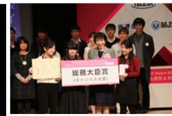
総務大臣賞 (ピアの極み乙女、)