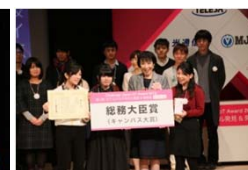
総務大臣賞 (ピュアの極み乙女、)