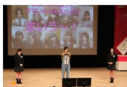
女性起業家大賞 (うまっぶ)