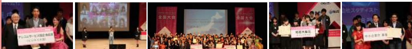
テレコムサービス協会会長賞 (ドレミグアアジア) 女性起業家大賞 (うまっぶ) 2015全国大会 総務大臣賞 (ピュアの極み乙女、) 中小企業長官賞 (スタディスト)

自分の主張を的確に表現すること。インカムをつけ舞台を自由に動き、自分のプレゼンにあったスタイル&パフォーマンスを期待しています。