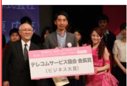
テレコムサービス協会会長賞 (ドレミングアジア)

自分の主張を的確に表現すること。インカムをつけ舞台を自由に動き、自分のプレゼンにあったスタイル&パフォーマンスを期待しています。