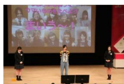
女性起業家大賞 (うまっぶ)