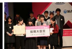
総務大臣賞 (ピュアの極み乙女、)